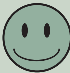
Terrænregulering med afstand til skel