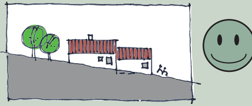
Terræn integreres i huset ved niveauskift