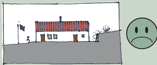
Terrænregulering med støttemur