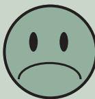
Terrænregulering hen til skel