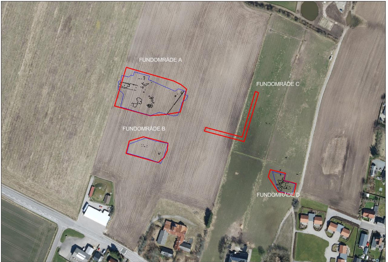
Fig 1. Kortudsnit med angivelse af de fire indstillede fundområder. Af disse kan Fundområde A, B og D frigives til jordarbejdet. Fundområde C skal undersøges, når etableringen af søen/bassinet planlægges at finde sted. Med rødt er markeret de efter forundersøgelsen indstillede arealer. Blåt angiver de faktisk muldafrømmede arealer. Sort angiver de registrerede, arkæologiske anlæg.