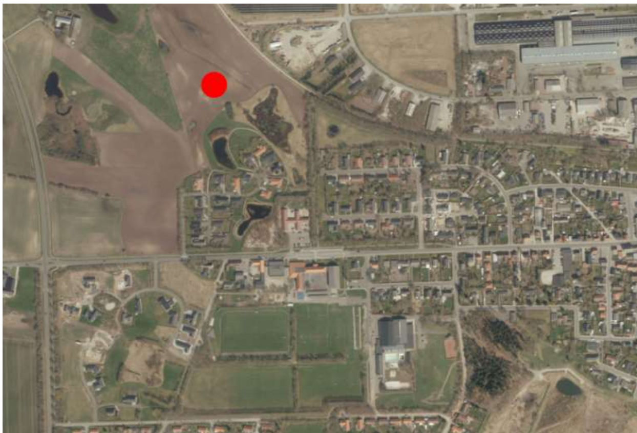
Langmosen etape 2 Aalestrup, markeret med rød prik.

I området hvor Langmosen ligger er der andre udstykninger med nyere boliger.